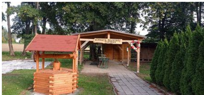
Přístřešek nad venkovní umývárnu