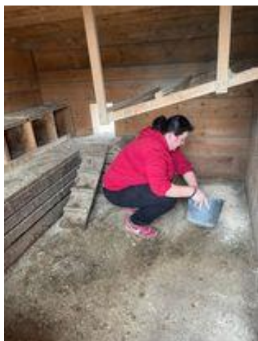
I slepičky jsou v novém a v čistém