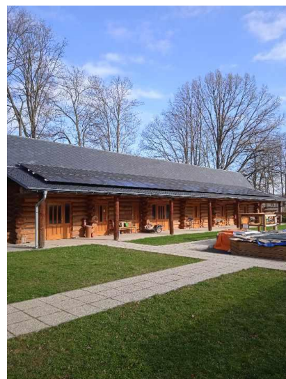
Fotovoltaika už funguje 12