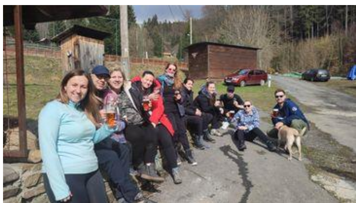
Jarní pobyt chata Pod Bukovínami