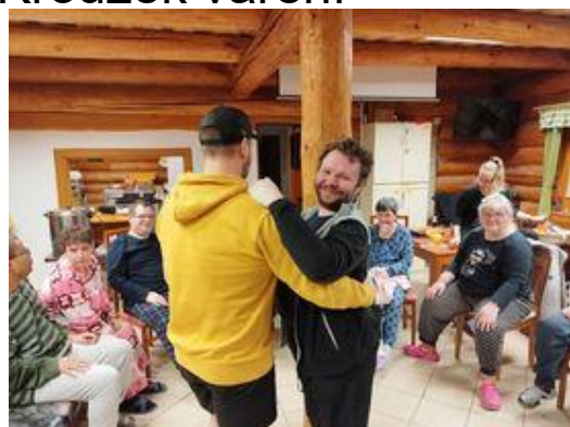
Víkendovka Dívčí Hrad