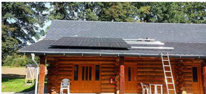
Začínáme s fotovoltaikou